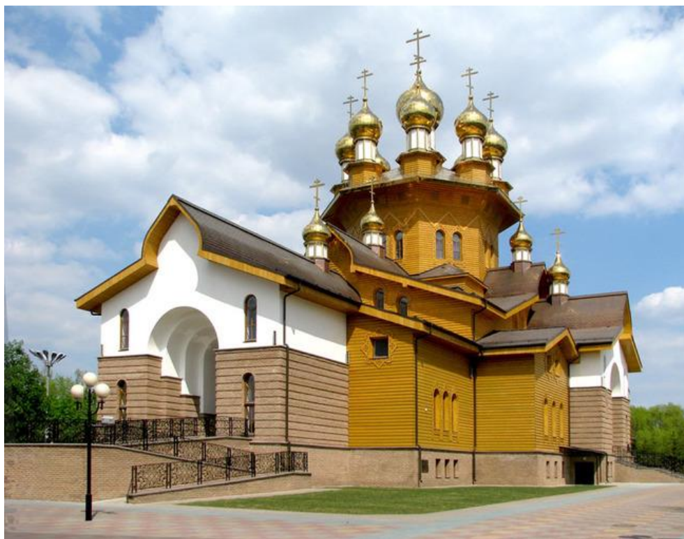
Церковь Веры, Надежды, Любви и Софии