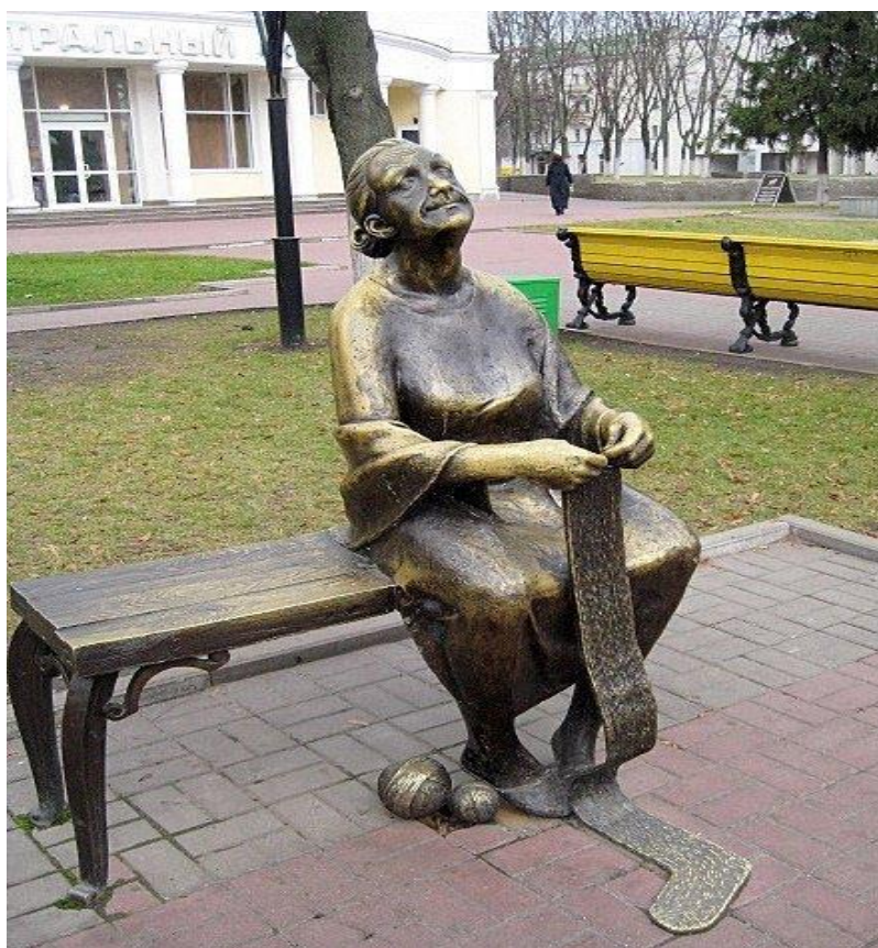
Памятник бабушке (2005 г.)

Советник отдела информационного обеспечения аппарата Думы