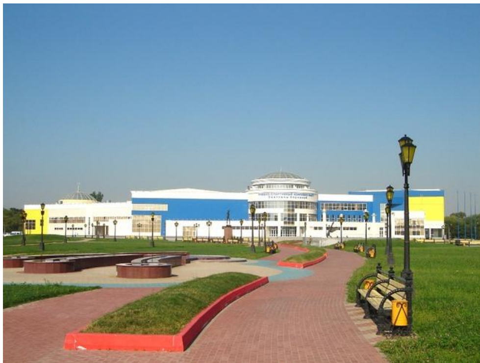
Спортивно-учебный комплекс Светланы Хоркиной (выпускницы БелГУ) расположен на территории БелГУ