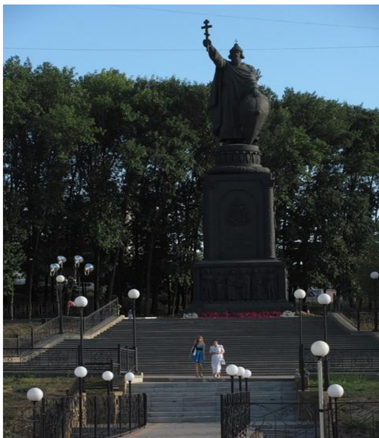
Памятник святому князю Владимиру «Красное Солнышко» - крестителю Руси