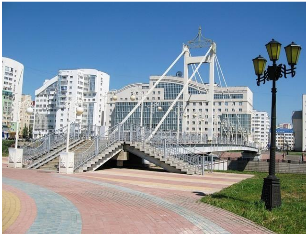
Мост через реку Везелка на Университетской набережной